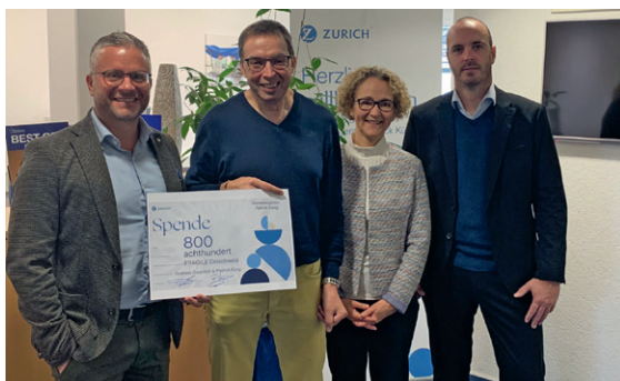
Checkübergabe der Zürich-Versicherung, Generalagentur Thurgau.

Dr. Stephan à Porta-Stiftung, Zürich Evang. Kirchgemeinde, Klosters-Serneus Evang.- Ref. Kirchgemeinde, Weinfelden Gemeinnütziger Frauenverein, Ennenda Kath. Kirchgemeinde, Rapperswil-Jona LOG Produktions AG, Degersheim