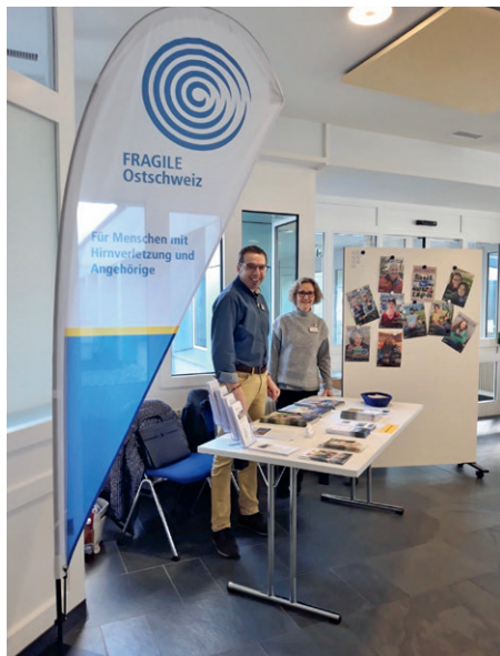
Informationstag im Rehaszentrum Valens.