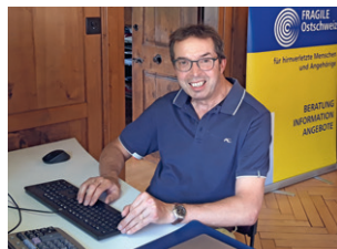
Der Präsident an seinem Arbeitsplatz in der Geschäftsstelle.