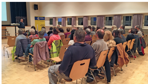
Vortragsabend in Zusammenarbeit mit Samariternvereinen.