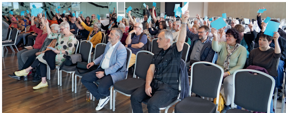
Generalversammlung im «Brüggli» Romanshorn.