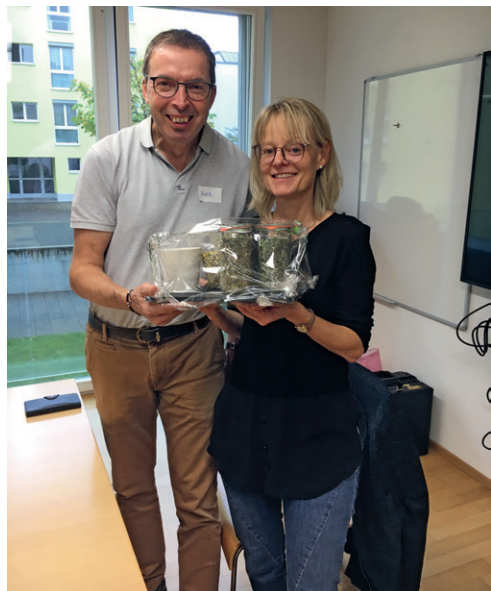
Moderatorentreffen im Haus Viv.Quimby St. Gallen.