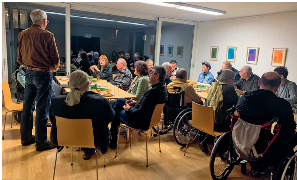
Gemütlicher Chlausabend der Selbsthilfegruppe St. Gallen im Haus Viv.Quimby.