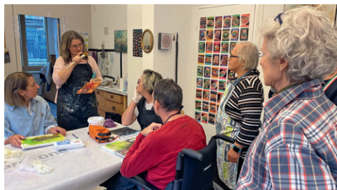
Kreativnachmittag der Selbsthilfegruppe Ilanz.